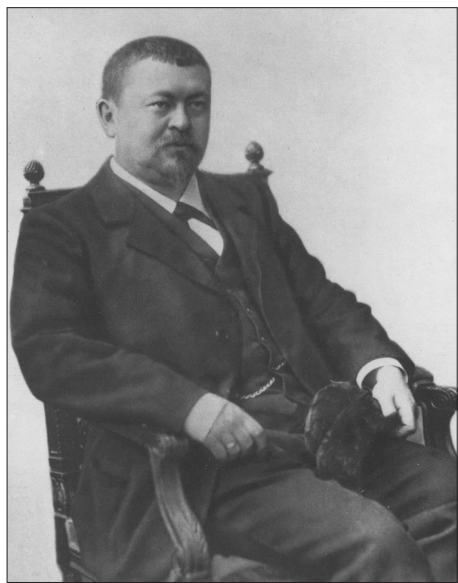
Савва Тимофеевич Морозов

В 1873 г. Тимофей Морозов переименовал семейное предприятие в Товарищество Никольской мануфактуры «Саввы Морозова сын и К». Спустя время она стала лучшей среди текстильных предприятий России. Вклад Тимофея Саввича в экономику страны был настолько велик, что ему – первому в России – пожаловали титул «Господин мануфактур – советник». В 1882 г. его наградили орденом Святой Анны.